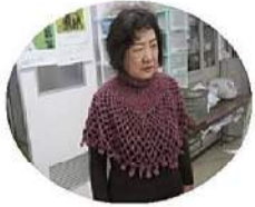
手編みのケープ あったかいよ

うたごえなど忙しい活動の中 で、「すこやか長崎」の折込み、 地域訪問等にはいつも参加し、 支部の活動にとって、心強い支 えです。